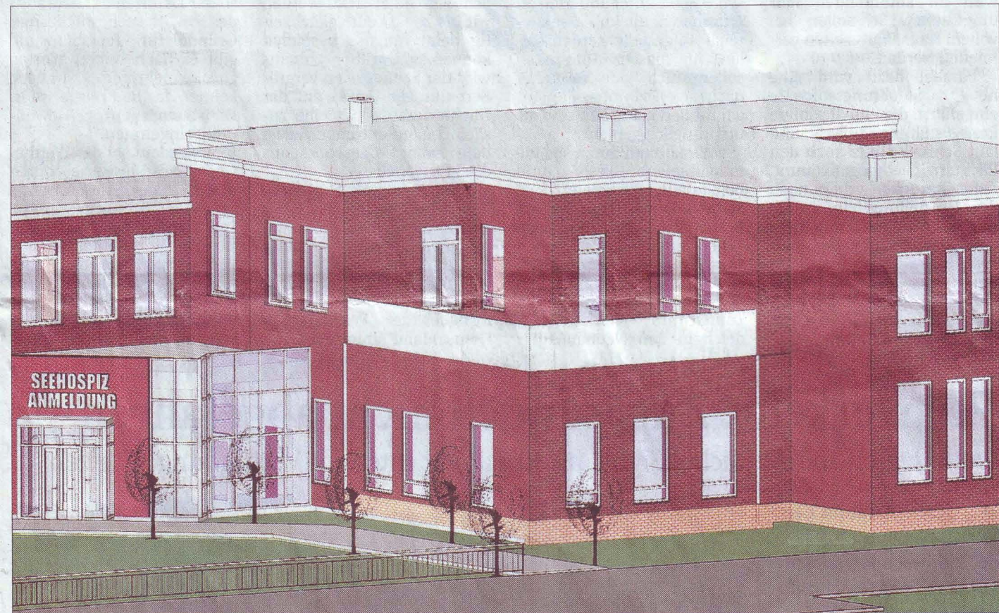
So soll das neue Zentrum des Seehospizes auf Norderney nach dem Umbau aussehen.

UMBAU Bislang gab es für die Patienten fünf verschiedene Anlaufstellen